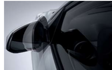
Espejos eléctricos plegables