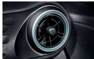
Ventilaciones de AC estilo de hélice única