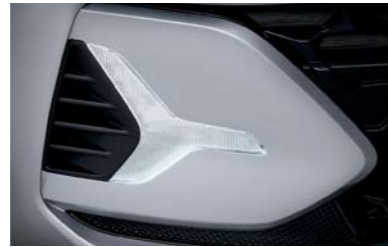
Luces para circulación diurna (DRL) LED