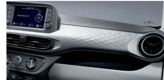
Paño + Vinilo