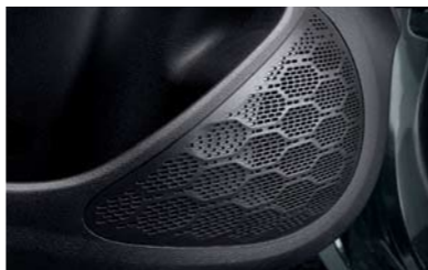
Sistema de cuatro parlantes delanteros/ traseros