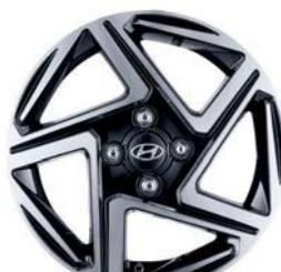
Llantas de aleación de 15"