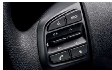
Bluetooth manos libres