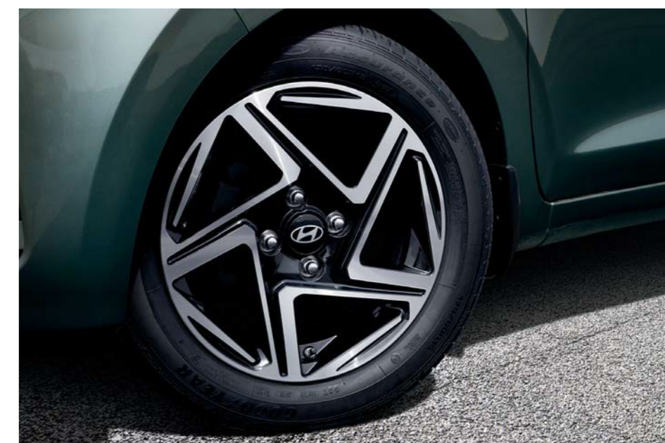
Llantas de aleación de 15"