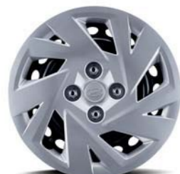
Llantas de acero de 14"