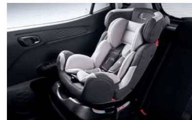
Sistema de anclaje para asientos infantiles ISOFIX