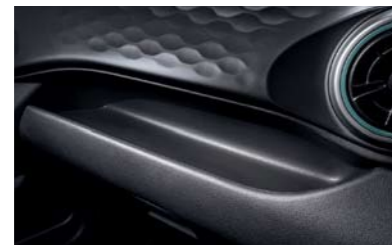
Área de almacenamiento práctica