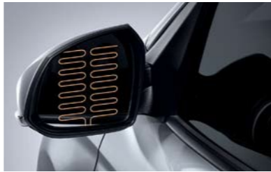
Espejos laterales con calefacción