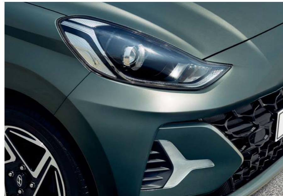
Faros delanteros de proyección / Luces para circulación diurna (DRL) LED