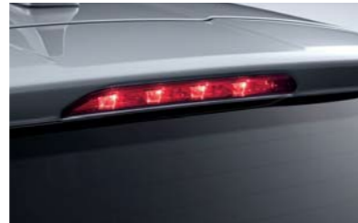
Luz de freno LED colocada en alto