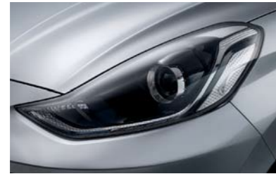
Faros delanteros de proyección