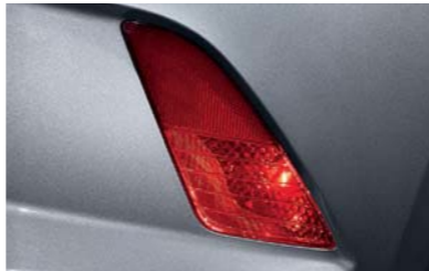
Luz antiniebla trasera