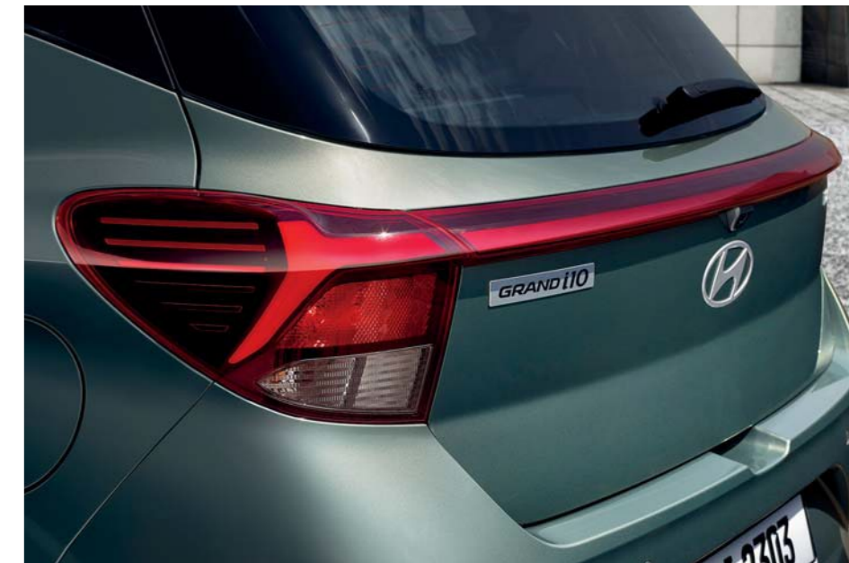
Faros traseros LED

El Grand i10 le lleva a su próxima aventura por carretera con un estilo atrevido y emocionante. Cada detalle amplifica el factor de diversión al volante. Incorpora llantas de aleación de 15 pulgadas y una parrilla más grande y atrevida pintada en negro que llama la atención al instante. Las luces LED añaden una nota de sofisticación de alta tecnología, mientras que el tratamiento de pintura en dos tonos crea una apariencia distintivamente moderna.