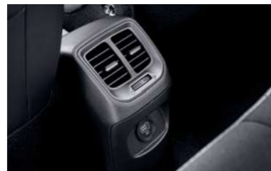
Ventilación de AC en la parte trasera