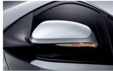
Espejos y repetidores exteriores