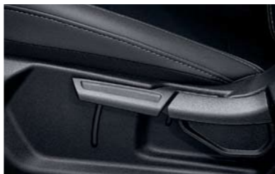
Regulador de altura del asiento del conductor