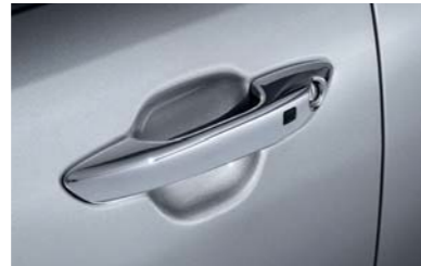
Manijas de puertas cromadas