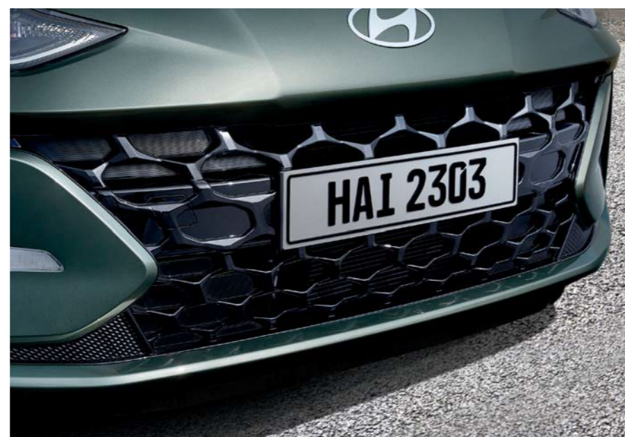
Parrilla del radiador en negro brillante