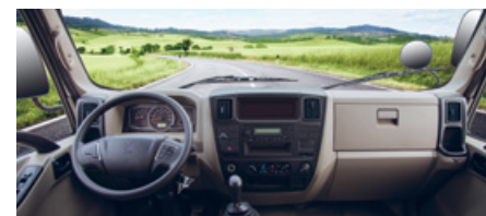
INTERIOR DE LUJO