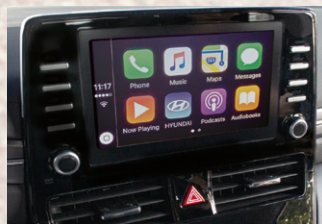
Radio táctil de 8" con Apple CarPlay y Android Auto