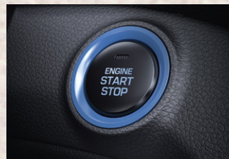
Botón de encendido